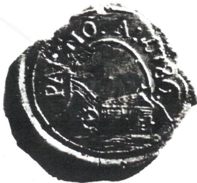
Pečat' z roku 1786